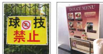
街中、公園の掲示物