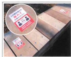
ソーシャルディスタンス② (マルチタック10 使用)