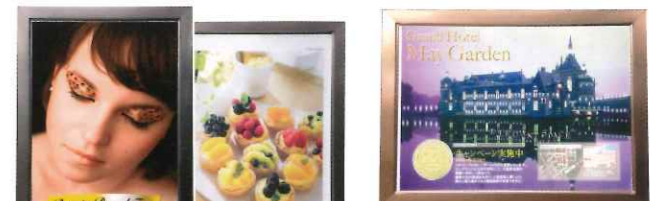
店頭ポスター、ご案内