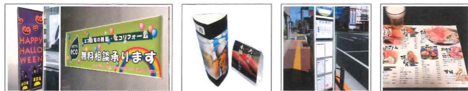
イベントポスター(長尺)