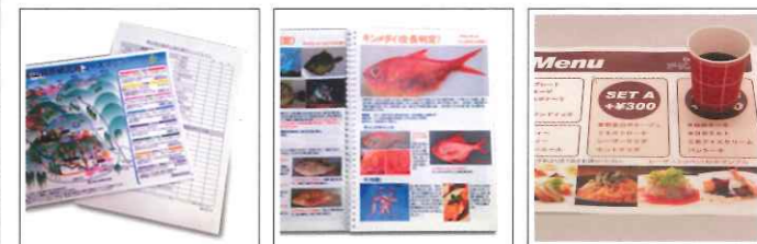
登山マップ、遠足のしおり

主な用途 屋外使用マニュアル・地図、登山マップ・メニュー、ランチョンマット、遠足のしおり