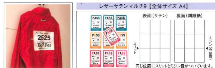
ゼッケン・イベントワッペン